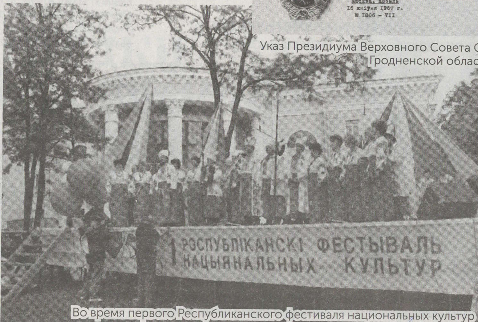
Во время первого Республиканского фестиваля национальных культур

На весь Советский Союз славился уровень развития сельского хозяйства. На базе области проходило много семинаров, постоянно шел обмен опытом. На весь СССР звучала наша система образования. Гродненщина ежегодно выходила победителем Всесоюзного соревнования за успешное выполнение государственного плана экономического и социального развития. В итоге области на вечное хранение было передано Красное Знамя. Это очень серьезный стимул и высочайшая оценка труда людей.