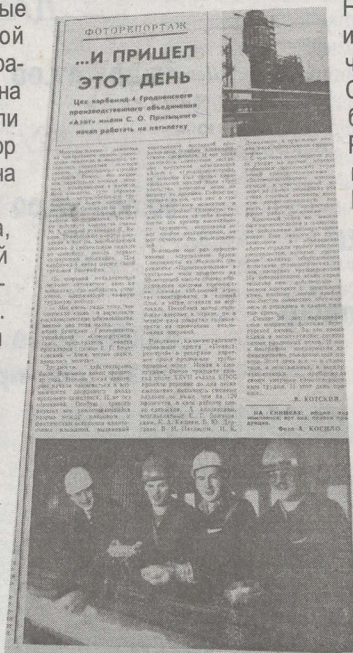
Репортаж в «Гродзенской праўдзе» о пуске цеха карбамид-4 на ГПО «Азот»